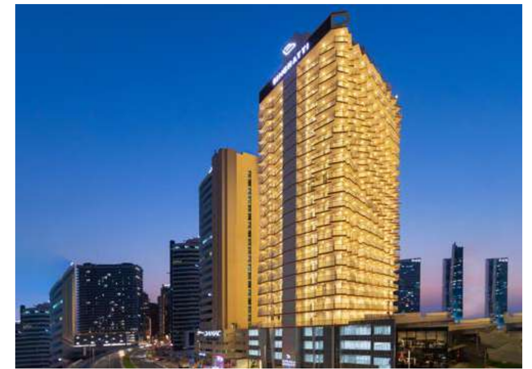
MILLENIUM BINGHATTI RESIDENCE