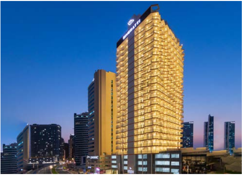
MILLENNIUM BINGHATTI RESIDENCE